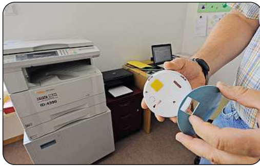
Bild 4: Für die Klebmontage bringt man das Klebepad auf der Rückseite an – bei Akustikdecken sicherlich die bessere Variante