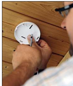
Bild 3: Bei den Holzdecken im Flur hat sich Jochen Weber für Schraubbefestigung per Einlochmontage entschieden

Auch die Melder abseits liegender Räume, wie etwa im zur Heizung führenden Treppenhaus, wurden stumm geschaltet. Bei der Stummschaltung kann man entscheiden, ob man nur Alarme oder auch Warnhinweise, wie zum Beispiel Batterietiefstand oder Störungen von anderen Meldern, unterdrücken möchte.